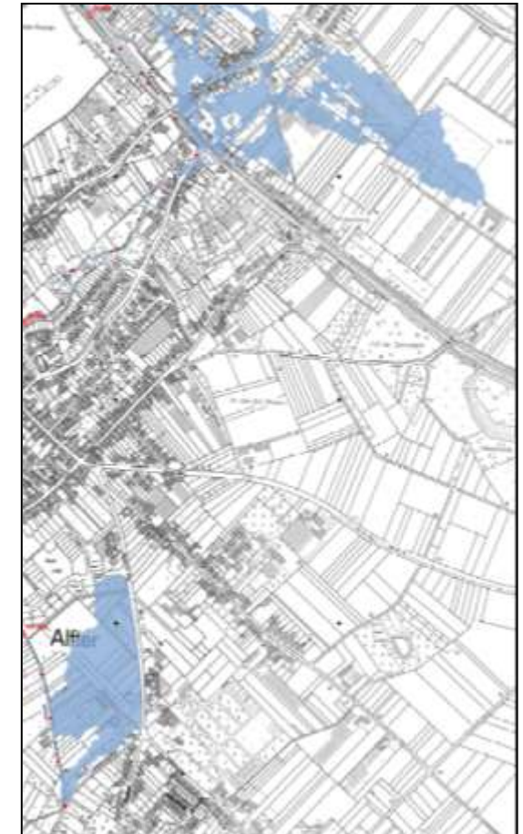
Ausschnitt aus Blatt 5 der Karte des Überschwemmungsgebietes des Alfterer-Bornheimer Baches. Die blau eingefärbten Bereiche sind als Überschwemmungsgebiet festgesetzt – links unten der Bereich unterhalb der Mirbachstraße, rechts oben ein Teil des Bereichs ab dem unteren Stühleshof.

In Überschwemmungsgebieten gelten nach § 78 des Wasserhaushaltsgesetzes in Verbindung mit § 113 des Landeswassergesetzes weitgehende Bauverbote . Sie umfassen auch Bauvorhaben im Geltungsbereich von Bebauungsplänen und solche, für die nach § 65 der Landesbauordnung NRW keine Baugenehmigung erforderlich ist, z.B. kleinere Gartenhäuser und Mauern unter 2 m.