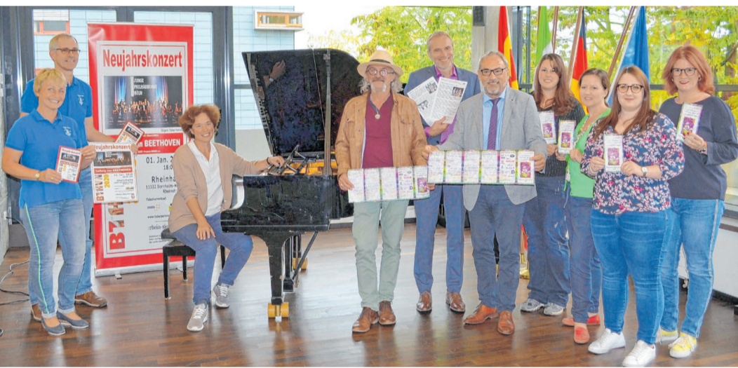
Die Stadt hat gemeinsam mit vielen Veranstaltern ein tolles Programm zusammengestellt.

Kostenlose Energieberatung der Klimaregion Rhein-Voreifel in Kooperation mit der Verbraucherzentrale NRW im Rathaus der Gemeinde Swisttal, 13. Februar 2020, 14 - 17:45 Uhr, Dauer: 45 Minuten. Anmeldung erforderlich unter 02222 945-285, E-Mail: tobias.gethke@stadt-bornheim.de