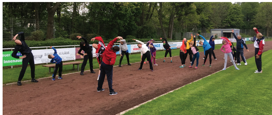
■ Gemeinsam trainieren macht Spaß.

Sportler aller Altersklassen sind ab Juni 2018 wieder eingeladen, im Franz-Farnschlader-Stadion in der Wallrafstraße in Bornheim für das Deutsche Sportabzeichen zu trainieren. An acht Donnerstagen von 18 bis 20 Uhr können Kinder, Jugendliche, Erwachsene und Senioren gemeinsam an kostenlosen Übungseinheiten teilnehmen und unter fachkundiger Anleitung ihre Ausdauer, Kraft, Schnelligkeit und Koordination verbessern.