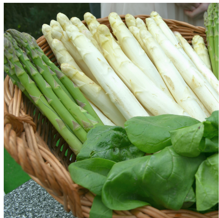
■ Ein Markenzeichen der Stadt ist der Bornheimer Spargel, der seit 2014 den gleichen Patentschutz wie Parmaschinken und Parmasankäse genießt.

Das Bürgerforum für die Rheinorte Hersel, Widdig und Uedorf hat bereits erfolgreich stattgefunden. Nun folgt das Forum für das südliche Bornheim mit den Ortschaften Bornheim, Brenig, Roisdorf und Dersdorf am Donnerstag, 25. August 2016, um 19 Uhr in der Kaiserhalle, Königstraße 58, 53332 Bornheim. Den Abschluss bildet dann das Bürgerforum für das nördliche Bornheim mit den Ortschaften Sechtem, Merten, Waldorf, Hemmerich, Walberberg, Kardorf und Rösberg am Dienstag, 13. September 2016, um 19 Uhr in der Gaststätte Vorgebirgsblick, Händelstraße 45, 53332 Bornheim-Merten.