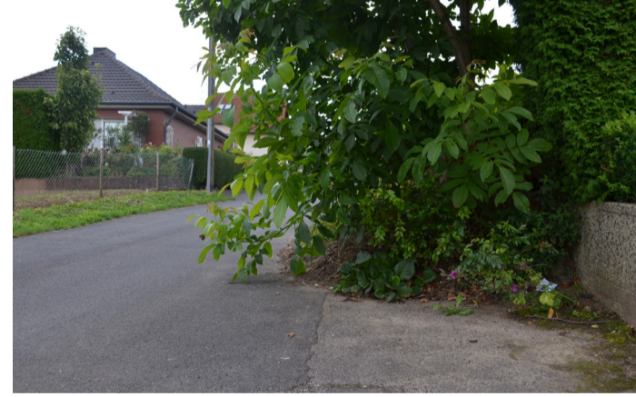
■ Überwuchs kann zu Ärger führen.

Es kommt immer wieder vor, dass an Kreuzungen, Einmündungen sowie Fuß- und Radwegen Behinderungen durch überhängende Äste und zu breit oder zu hoch wachsende Hecken bestehen. Auch Straßenlampen und Verkehrszeichen sind oft durch privates Grün zugewachsen. Sowohl die Verkehrssicherheit als auch die Orientierung aller Verkehrsteilnehmer wird dadurch beeinträchtigt.