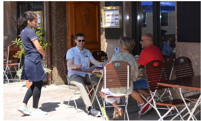
■ Ein Zeichen der gestiegenen Attraktivität: Viele Gewerbetreibende nutzen die großzügigen Bürgersteig-Flächen bereits für Außengastronomie.

Im Ortszentrum werden derzeit Sitzbänke und Blumenkübel aufgestellt, Fahrradständer installiert sowie Abfallbehälter angebracht. Zur Sicherung des Fußgängerbereichs werden im Verlauf des einbahnigen Abschnitts der Königstraße und im Bereich des Peter-Fryns-Platzes Poller montiert. Weitere Poller ersetzen zukünftig die Anfahrtschwellen vor der gegenüberliegenden Bäckerei. Daneben wird ein Kunstwerk des Bornheimer Steinmetzes und Steinbildhauers Helmut Sistig die Königstraße zieren. Bis Ende August soll auch die Umgestaltung des Peter-Fryns-Platzes weitgehend abgeschlossen sein. Lediglich eine kleine Fläche von drei bis vier Metern entlang der Polizeiwache und der Regionalfiliale Bornheim der Kreissparkasse Köln wird noch nicht bepflanzt, da beide Gebäude noch modernisiert werden. Bis auf diesen kleinen Abschnitt steht der Peter-Fryns-Platz sowohl für das Bornheimer Gewerbefest als auch für die Bornheimer Kirmes am ersten September-Wochenende und natürlich auch danach für alle geplanten Aktivitäten zur Verfügung. Da an verschiedenen Stellen Stromanschlüsse und ein Wasseran-